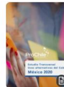
Estudio Transversal Usos alternativos del Cobre México 2020