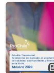
Estudio Transversal Tendencias de mercado en productos sostenibles: oportunidades y brechas para Chile México 2020