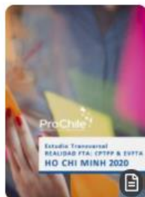
Estudio Transversal Realidad TLC Vietnam, Ho Chi Minh 2020