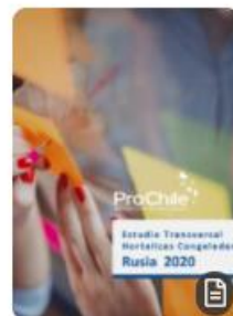
Estudio Transversal Hortalizas Congeladas Rusia 2020