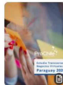
Estudio Transversal Negocios Virtuales, Paraguay 2020