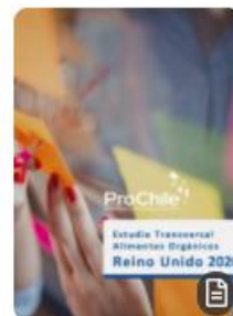
Estudio Transversal Alimentos Orgánicos Reino Unido 2020