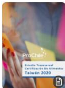
Estudio Transversal Certificaciones de Alimentos Taiwán 2020