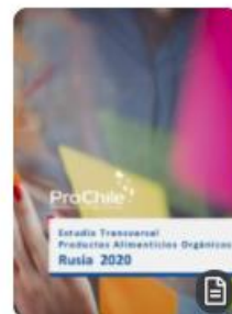
Estudio Transversal Productos Alimenticios Orgánicos Rusia 2020